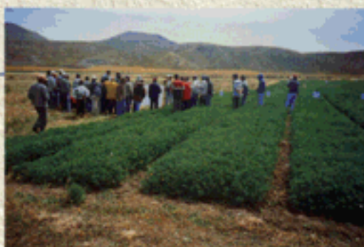
Validación de variedades de alfalfa en el altiplano con la cooperación del CEAC - UTO

Demostrando al sector productivo agropecuario las cualidades de las variedades mejoradas y alternativas tecnológicas para el manejo agronómico de sus cultivos