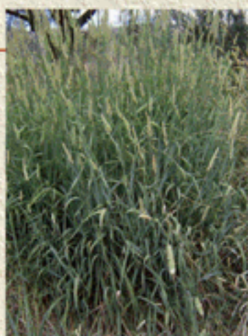
Pasto brasileiro, opción técnica para la conservación de suelos

Generando tecnologías en la conservación de forrajes