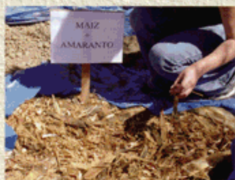
Ensilaje de dos especies con calidad superior al tradicional ensilaje de maíz

Produciendo semillas, plantines de pastos, árboles y arbustos para forraje y conservación de suelos